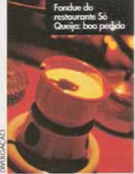
Fondue do restaurante Só Queijo: boa pedida

Um chef, brasileiro, sempre gostei de ir para Campos do Jordão, que é um lugar muito bom de se estar. Não gosto de ficar muito tempo na cidade, mas quando vou, vou aproveitar ao máximo. Vou para lá com a família e vou aproveitar ao máximo. Vou para lá com a família e vou aproveitar ao máximo. Vou para lá com a família e vou aproveitar ao máximo.