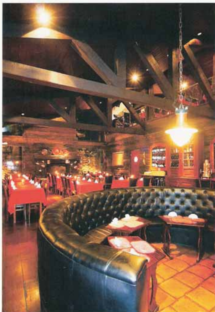
Texto: Diego Sieg

E m Campos do Jordão, com o objetivo de evidenciar ainda mais a atmosfera de romantismo e requinte, o Só Queijo, tradicional restaurante há 40 anos no mercado, passou por uma transformação em seus ambientes. O desejo da proprietária de ampliar as instalações e garantir mais funcionalidade e praticidade no dia-a-dia de trabalho foi alcançado com o projeto da arquiteta Ana de Melo Araujo. Os salões de atendimento, já existentes, foram integrados e ganharam a companhia de um mezanino com varanda. O pé-direito nas alturas – marcado pelas tesouras em madeira – e os grandes panos de vidro levam amplitude e iluminação natural aos espaços. O caminho lateral com paisagismo conduz ao subsolo, onde foram criados adega, gazebo e espaço para serviços. Sem perder a identidade visual do restaurante, a decoração segue uma linguagem rústica, reforçada pelos revestimentos e móveis.